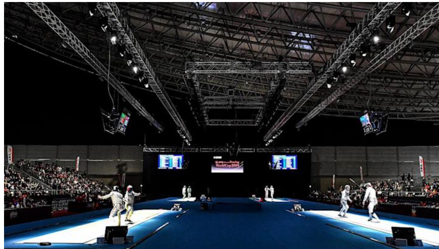
سالن برگزاری مسابقات ۲۰۲۰ توکیو

بخش مهمی از ساختار شمشیربازی المپیک، وجود مسابقات تیمی در کنار مولفه‌های مسابقات انفرادی است. بسیاری از ورزش‌های انفرادی دارای رقابت‌های تیمی در المپیک هستند مانند ژیمناستیک، شنا و غیره. یکی از دلایل آن این است که این ساختار به کشورها اجازه می‌دهد تا، بجای تنها مبارزه علیه یکدیگر، گرد هم نیز جمع شوند و در کنار یکدیگر به مبارزه بپردازند، و این باعث ایجاد رفاقت و دوستی بیشتری می‌شود.