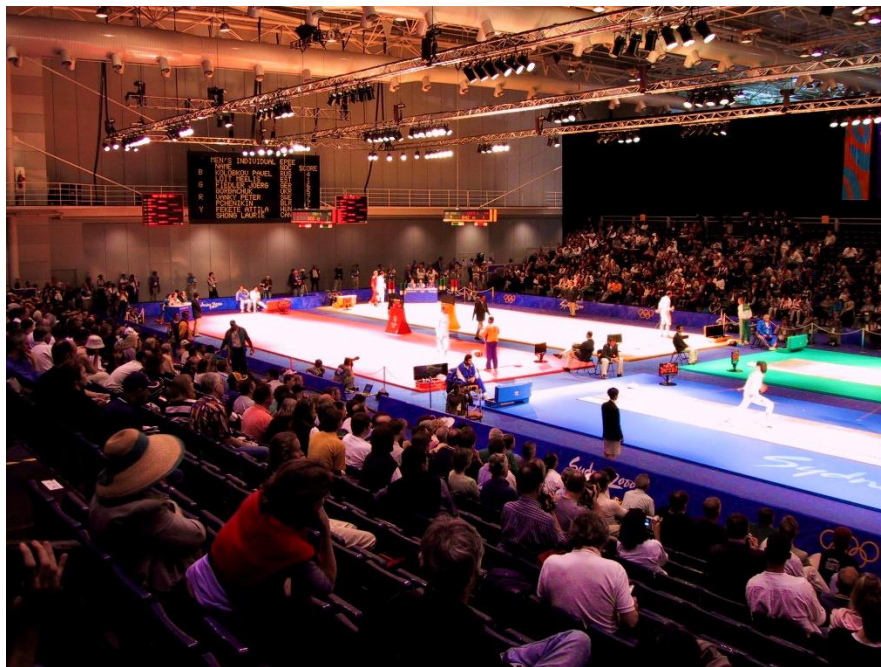
سالن برگزاری مسابقات ۲۰۰۰ سیدنی

مسابقات تیمی از جذاب ترین رویدادهایی است که باید حتما تماشا کنید. قالب رالی قشنگ ترین بازی دراماتیک ورزشی را در المپیک ایجاد می کند، زیرا یک تیم بازنده در یکی از ۹ بازی شانس دارد که در بازی بعدی از حریف جلو بیافتد.