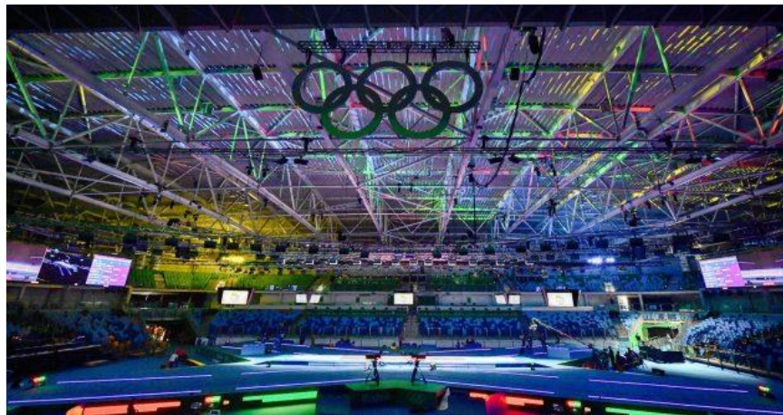
سالن برگزاری مسابقات ۲۰۱۶ ریو

شمشیربازی المپیک طی صد و بیست و هفت سال گذشته به طور قابل توجهی متحول و تکامل یافته است و سفر کاملاً جالبی را طی کرده است. درک نحوه تغییر و تحول شمشیربازی به عنوان بخشی از بازی های المپیک می تواند به درک ما از شمشیربازی امروزی کمک کند و دید ما در مورد اینکه این ورزش در آینده ما را به کجا خواهد برد، بازتر خواهد کرد.