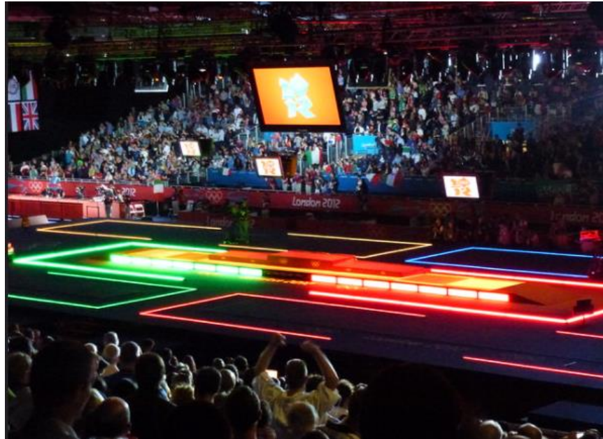
سالن برگزاری مسابقات ۲۰۱۲ لندن

در فاصله زمانی طولانی از سال ۱۹۲۴ تا ۱۹۹۲ فلوره تنها سلاح بانوان در شمشیربازی بازی های المپیک بود. اولین زنی که در المپیک شرکت کرد در سال ۱۹۰۰، یعنی دومین المپیا، بود اما در شمشیربازی نبود. در حقیقت، در مسابقات زنان و مردان در بازی های المپیک هنوز برابری وجود ندارد، و اگرچه زنان در همه ورزش ها فعالیت دارند اما در توکیو تنها ۳۹ رویداد برای زنان در نظر گرفته شده است. گنجاندن سایر زنان در المپیک جدیدترین تغییر بود که به دنبال روند باز شدن راه بانوان در مسابقات بین المللی سایر انجام شد. ما در اینجا فرصت نداریم خیلی به این موضوع بپردازیم، اما در کتاب خود Runnings Cool to World Superpower با جزئیات بیشتر در مورد آن صحبت کرده ایم.