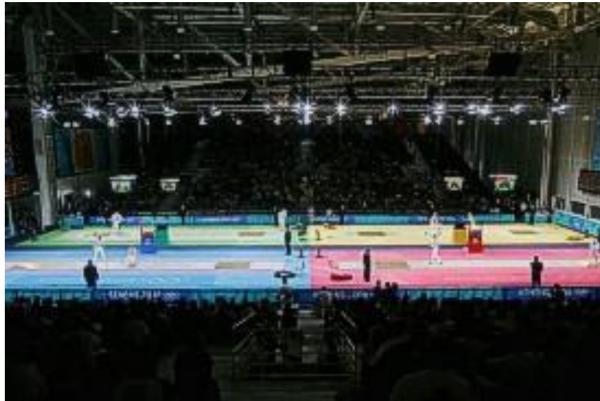
سالن برگزاری مسابقات ۲۰۰۴ آتن

برخلاف سایر مسابقات شمشیربازی، تنها یک مدال برنز اعطا می شود، بنابراین برای تعیین مقام سوم انفرادی المپیک یک بازی انجام می شود، که قبل از فینال نهایی مدال طلا اجرا می شود.