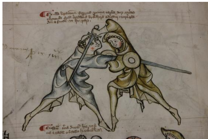
تصویری از کتاب The Royal Armouries

در این بین، شمشیربازی در اروپا بصورت مبارزه جنگجویی ادامه یافت. ایده شوالیه مسلح به شمشیر که همه ما در مورد قرون وسطی می دانیم معرف همین قضیه است؟ در اینجاست که شمشیربازی اصل و نسب خود را در این دوره زمانی ردیابی می کند. در این زمان سپر به اندازه شمشیر مهم است، شاید حتی از شمشیر هم مهم تر بود، بنابراین با آنچه امروز در ورزش خودمان داریم بسیار متفاوت بود. در این دوره، زره های سنگین، همزمان با بیماری، این قاره را شدیداً آزار می داد. خشونت، واقعیت زندگی این دوره بود، به همین دلیل نیمه اول قرون وسطی را به نام دوره تاریک تاریخ اروپا می دانند. تکنیک ها در طول این مدت به طرز چشمگیری تغییر کردند، از جمله گسترش جنگ شمشیرزنی با دو دست و ترکیب های زیادی با سلاح های دیگر. هر چیزی که خلاقیت بازی را بالا می برد به یکی از جنبه های فوق العاده مهم در مبارزه با شمشیر تبدیل شد. هر چقدر می توانستید در مبارزه خلاقیت بیشتری داشته باشید، می توانستید در دوره زمانی کشتن و کشته نشدن بیشتر زنده بمانید. در این دوره تقریباً هیچ تعریفی برای شمشیرزنی بعنوان ورزش نمی توان یافت.