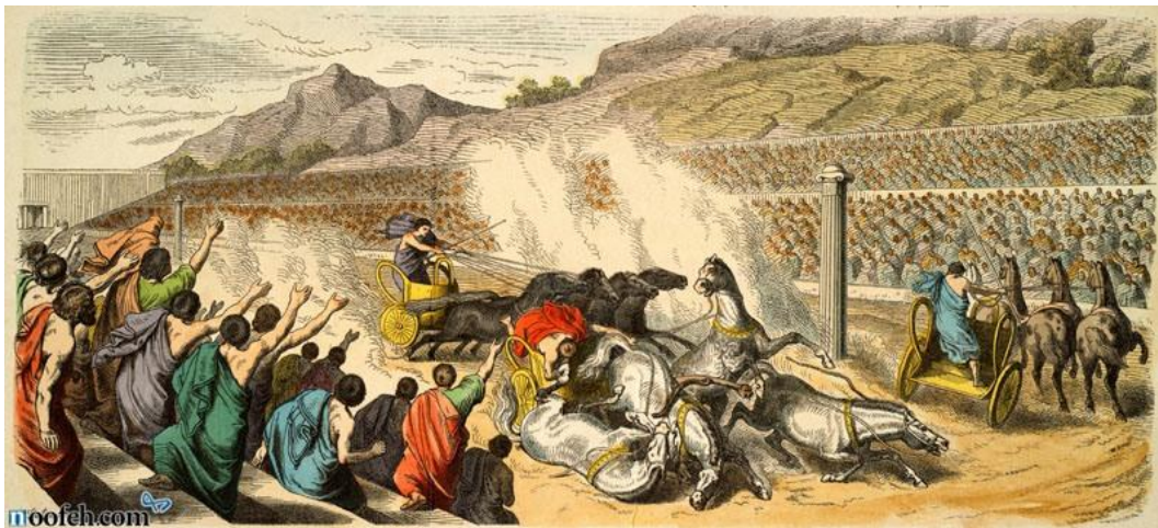
بازی های المپیک در یونان باستان بسیار پرطرفدار بود.

البته که المپیک از یونان آغاز شد و در حال حاضر مظهر ورزش مدرن ماست. اگرچه شمشیربازی همیشه یکی از رشته های بازی های مدرن المپیک بوده است، اما یکی از ورزش های اصلی بازی های المپیک باستان نبوده است. این بازی ها شامل پنتاتلون ، پرش ، پرتاب دیسک ، کشتی ، بوکس ، پنکراسیون (یک ورزش رزمی که کشتی و بوکس را با هم مخلوط می‌کرد و در سال ۶۴۸ قبل از میلاد مسیح به بازی ها معرفی شد) و مسابقات سوارکاری بود. دیری نگذشت که شمشیربازی نیز جای خود را در المپیک مدرن باز کرد.