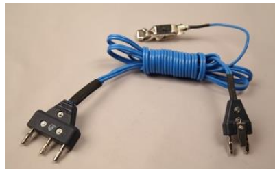
فلوره و سابِر